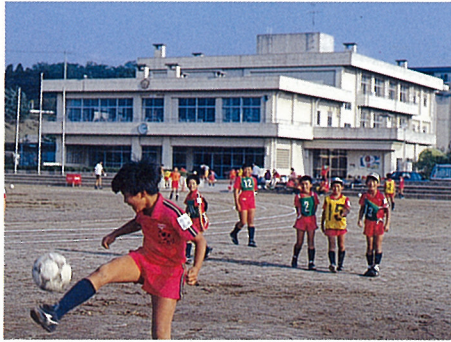
小竹小学校(徒歩1分)