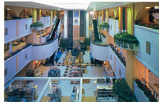
ユーカリが丘・サティ

通学校・カルチャー・公園・ショッピング…。 これら便利施設がごく近くに揃っているのも、 《ヒルトップ・ユーカリが丘》ならではの魅力です。 恵まれた環境の中で、遊び学ぶことができる—、 とりわけ小さなお子様がいらっしゃるご家庭に とっては、その価値は大きいと言えます。 時にはお子様とごいっしょに自転車でユーカリ が丘めぐりなぞいかががでしょう。まだ知らなかつ たユーカリが丘と出合うためにも—。