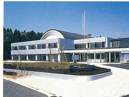
無料で学童保育も行っている 志津コミュニティーセンターと南公園(徒歩9分)