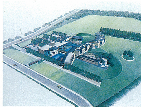
和洋女子大学佐倉セミナーハウス(徒歩1分)